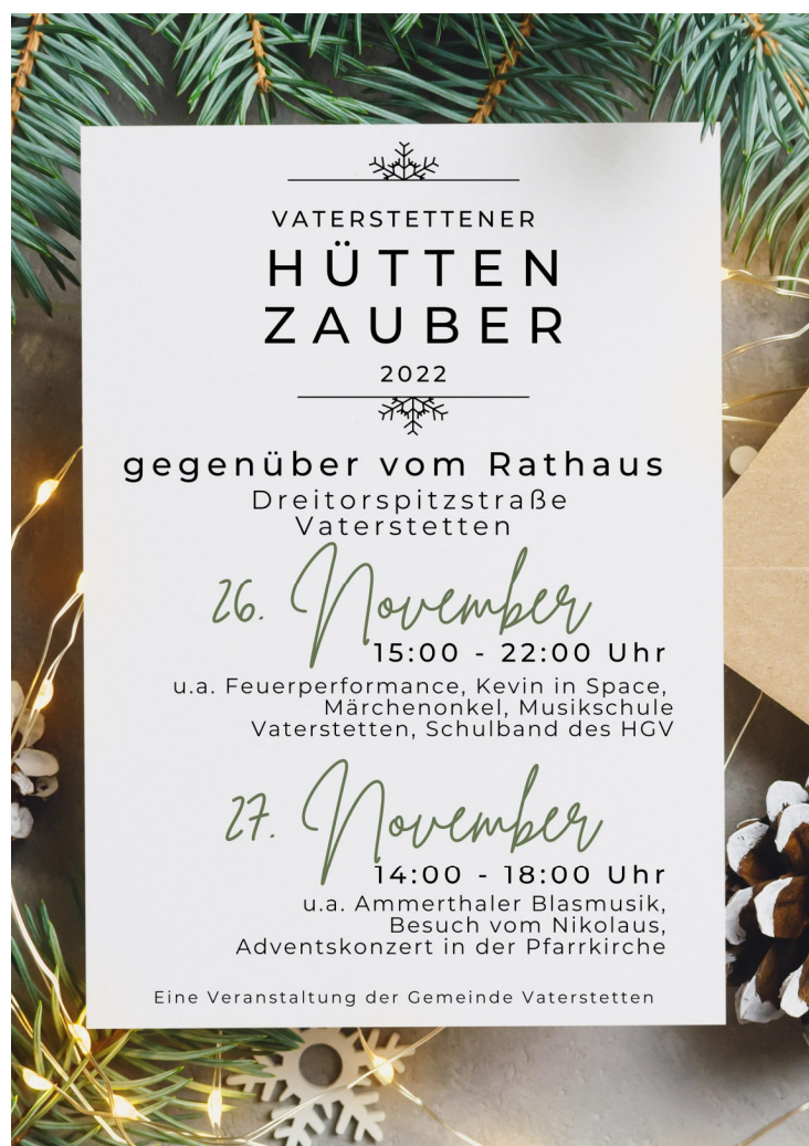
Das offizielle Plakat des Vaterstettener Hüttenzauber

Gemeinde Vaterstetten Presse- & Öffentlichkeitsarbeit Wendelsteinstraße 7, 85591 Vaterstetten