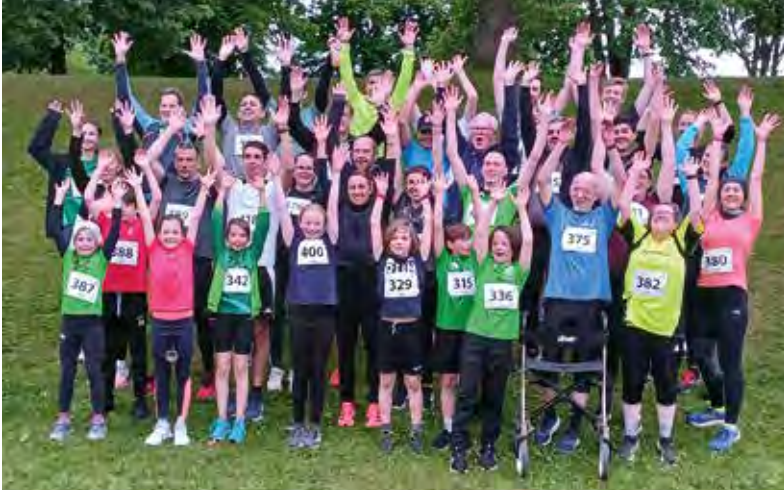
Gruppenbild vom Hobby-Lauf über eine Meile (2025)