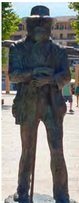
In Aix-en-Provence erinnert eine Statue an den Impressionisten Paul Cézanne.