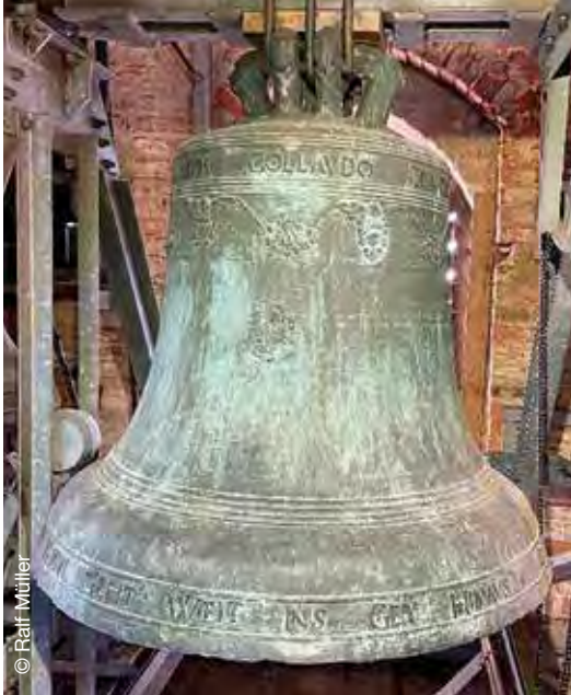
Die älteste Glocke auf dem Gemeindegebiet hängt in St. Laurentius in Purfing und wurde 1660 gegossen.