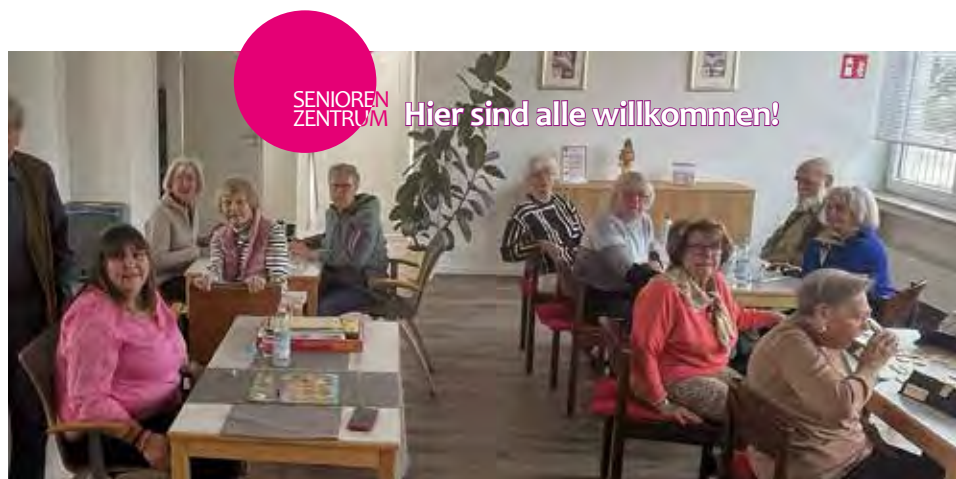
Das Senioren Zentrum in Baldham hat sich zu einer wichtigen Begegnungsstätte für ältere Bürgerinnen und Bürger entwickelt.