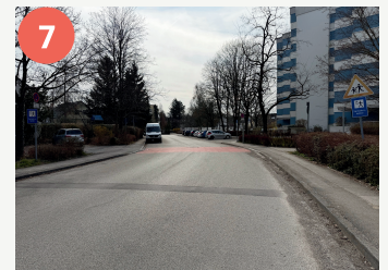
7 Lotsenpunkt Rossinistraße