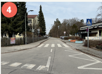
4 Lotsenpunkt Glückstraße