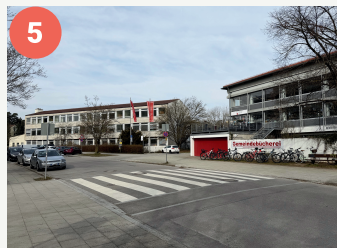
5 Lotsenpunkt Gemeindebücherei