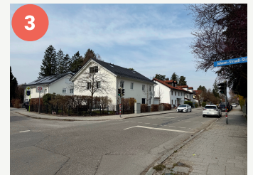
3 Lotsenpunkt Johann-Strauß-/Heinrich-Marschner-Straße