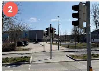
2 Lotsenpunkt Johann-Sebastian-Bach-Straße