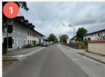
1 Lotsenpunkt Baldham Dorf

Diese Punkte auf dem Schulweg erfordern eine besondere Aufmerksamkeit