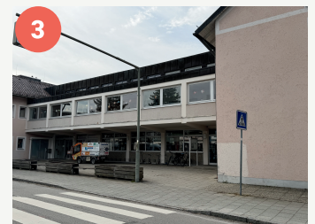
3 Zebrastrifen Wendelsteinstraße