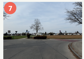
7 Querungsstelle Friedenstraße