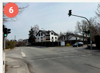
6 Lotsenpunkt Möschenfelder Straße/Luitpoldring