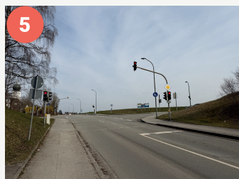
5 Lotsenpunkt Zugspitz-/ Möschenfelder Straße