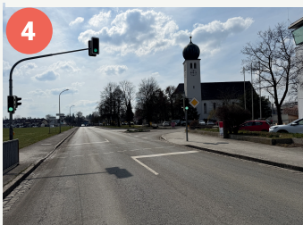
4 Fußgängerampel Möschenfelder Straße