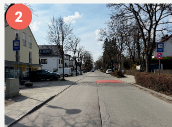
2 Lotsenpunkt Bahnhofstraße