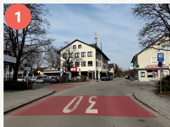
1 Lotsenpunkt Zugspitzstraße

Diese Punkte auf dem Schulweg erfordern eine besondere Aufmerksamkeit