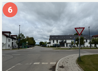
6 Gefahrenstelle Knotenpunkt Parsdorfer-/Wald-/Brennereistraße (Hergolding)