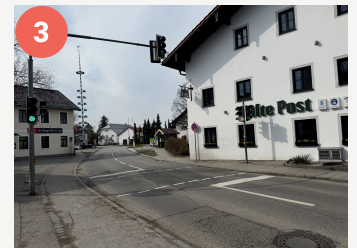
3 Fußgängerampel Dorfplatz (Parsdorf)