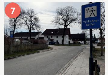
7 Einmündung Unterfeldweg (Purfing)