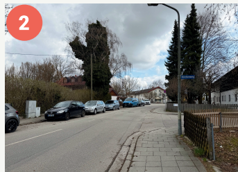
2 Einmündung Kirchenweg (Parsdorf)