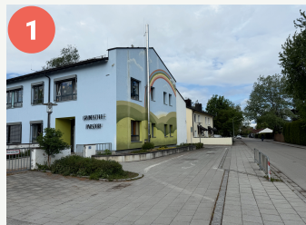
1 Ausstiegsstelle Schulbus (Parsdorf)

Diese Punkte auf dem Schulweg erfordern eine besondere Aufmerksamkeit