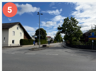
5 Gefahren-/Querungsstelle Parsdorfer Straße (Weißenfeld)