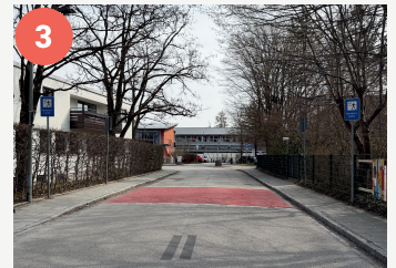
Lotosenpunkt Neue Poststraße