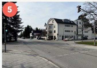
Lotosenpunkt Karl-Böhm-/ Brunnen-/Waldstraße