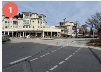
Kreisverkehr Karl-Böhm-/ Finkenstraße

Diese Punkte auf dem Schulweg erfordern eine besondere Aufmerksamkeit