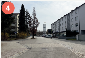
Querung am Knotenpunkt Kastanienweg/Alte Poststraße